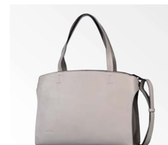
● Gabor Bags 8662 72