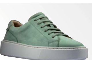
● Hero Lite Lace – Mint Green Suede