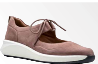
● Un Rio Skip – Dusty Pink Suede