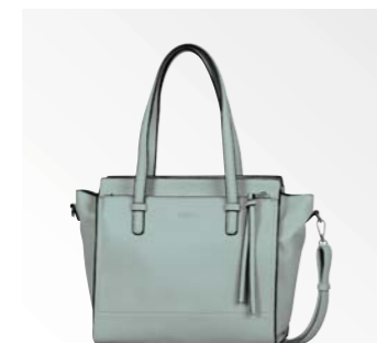
● Gabor Bags 8411 52