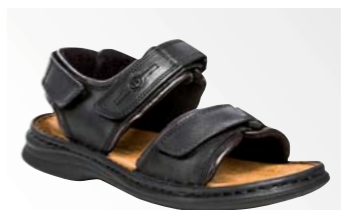
● josef seibel 10104 35602