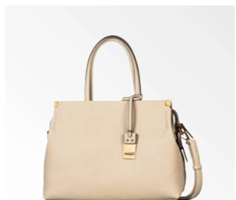
● Gabor Bags 8331 23