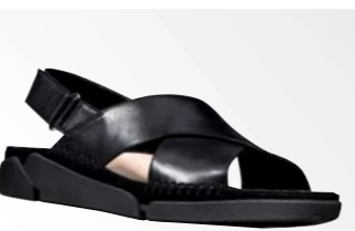
● Tri Alexia – Black Leather