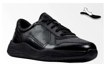
● Clarks Sift Speed - Black leather