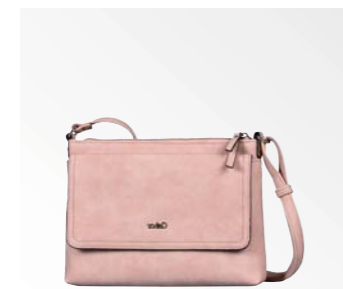
● Gabor Bags 8358 03