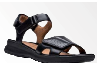
● Un Adorn Calm – Black Leather