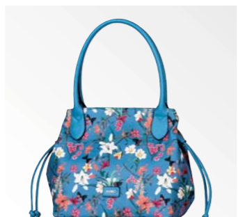
● Gabor Bags 8647 128