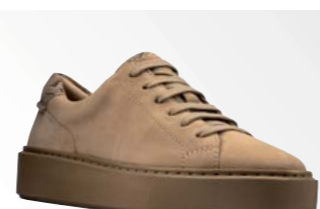
● Hero Lite Lace – Taupe Combi