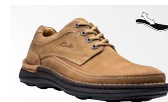
● Clarks Nature Three - Dark sand nubuck