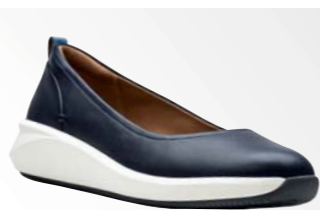
● Un Rio Vibe – Navy Leather