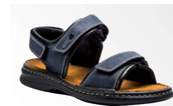
● josef seibel 10104 11582