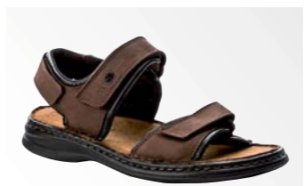
● josef seibel 10104 11341