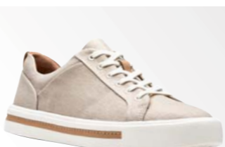
● Un Maui Lace – Gold Textile