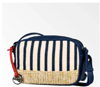
● Gabor Bags 8671 186