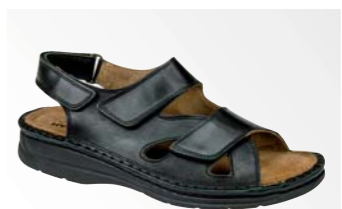
● Hartjes 080625-0100